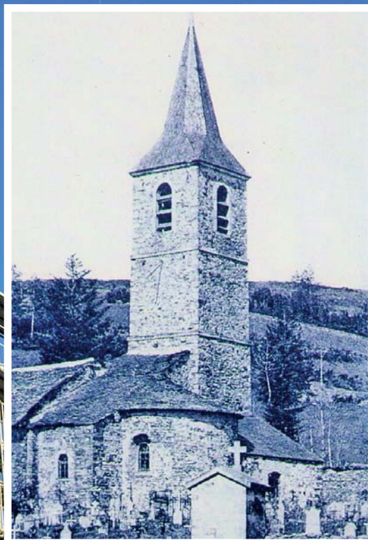
Travaux à l'église Saint-Etienne Page 6