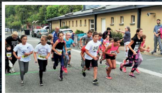
Associations Page 10