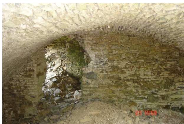
Cédric Indembergé (Juillet 2006)

Souscription « Fondation du patrimoine – Canac »