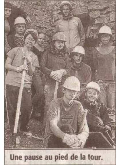
Une pause au pied de la tour.