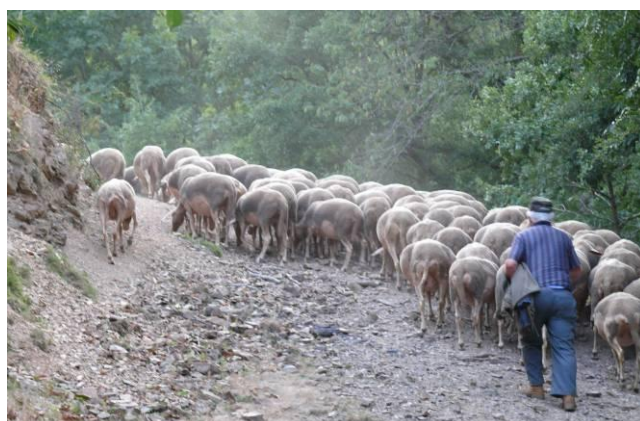
Charlotte Cavalier (Août 2008)